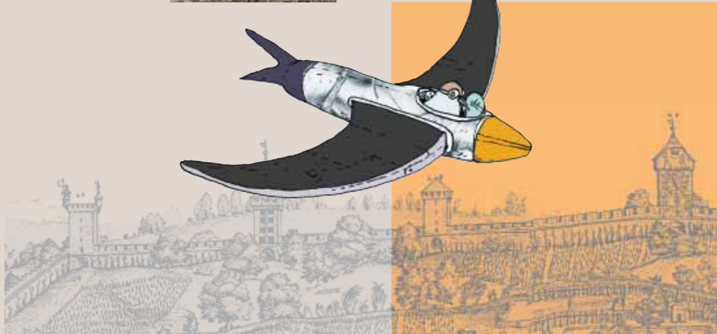
Martiniplan 1597; Eigentum Korporation Luzern